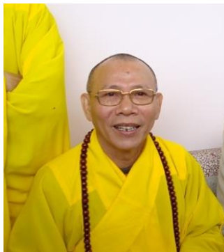
HT Thích Không Tánh